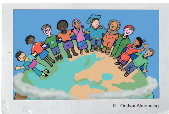
Ill.: Oddvar Almenning