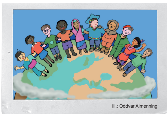
Ill.: Oddvar Almenning