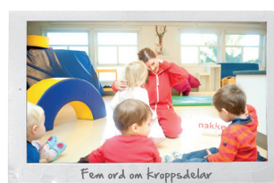
Fem ord om Kroppsdelar