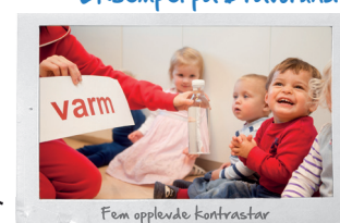
Fem opplevde Kontrastar