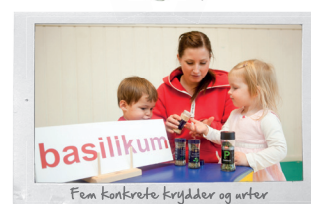
Fem konkrete Krydder og urter